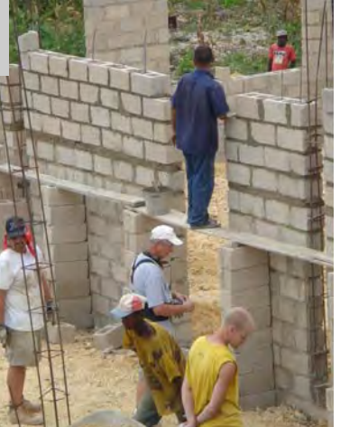
Paredes construidas para tres habitaciones