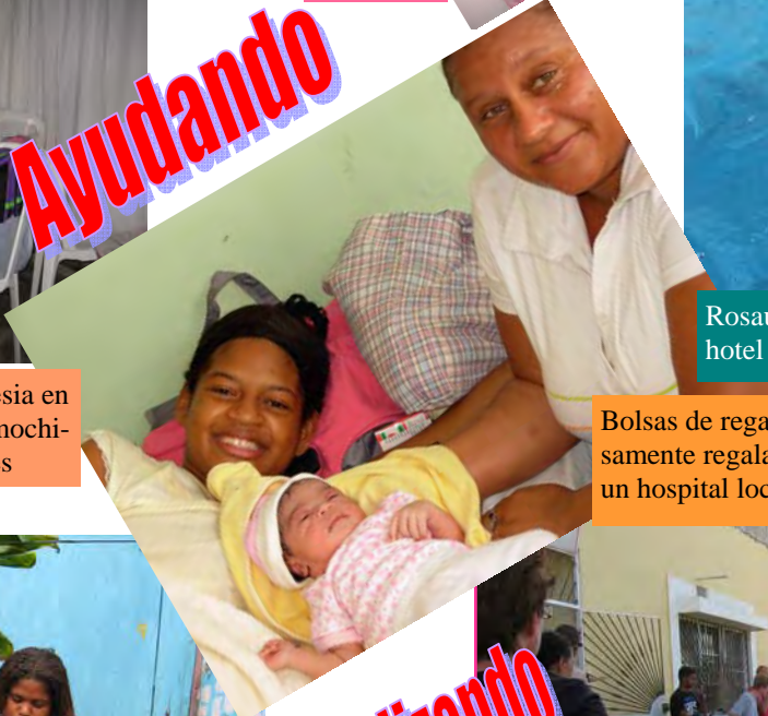
Bolsas de regalo para maternidad, pañales, etc. amorosamente regalados por el equipo a nuevas madres en un hospital local donde fueron gratamente recibidas