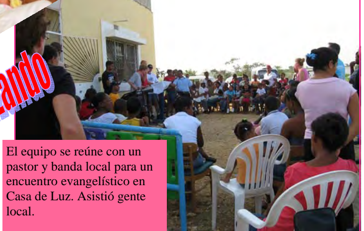
El equipo se reúne con un pastor y banda local para un encuentro evangelístico en Casa de Luz. Asistió gente local.