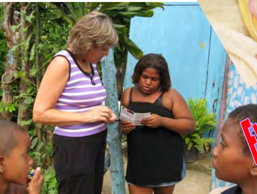
Miembro del equipo comparte el evangelio en español con una muchacha del lugar que no pertenecía al hogar .