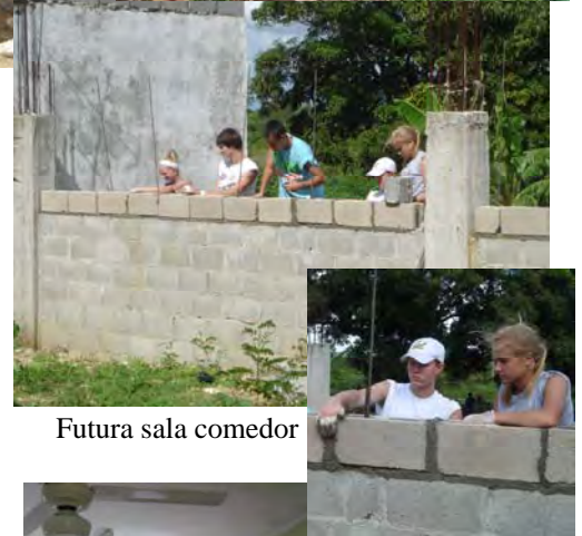
Futura sala comedor