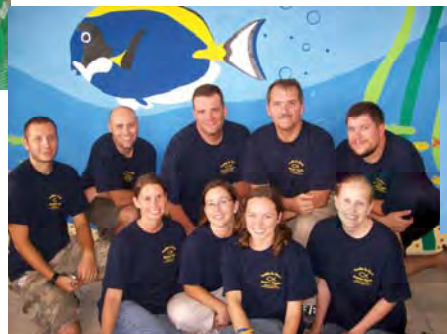
Equipo de pintores del dormitorio acuático