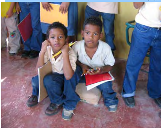
Los niños reciben materiales escolares en noviembre de parte de un grupo misionero de Project Child.

Cómo puede participar usted: Trayendo patrocinadores que donen con regularidad para cubrir los costos del personal y la comida para los niños actuales y 12 más. ¡Tenemos el lugar! Fondos para la construcción y completar el segundo piso de Casa de Luz, más otros proyectos. ¡Acompáñenos a un futuro viaje misionero! Todas las edades son bienvenidas. Donaciones de electrodomésticos, equipo médico, ropa, etc. en St. Petersburg, FL para llenar el contenedor que se envía a la RD. Contáctenos para informarse sobre cómo ser nuestro socio en esta tarea.