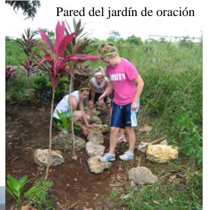
Pared del jardín de oración