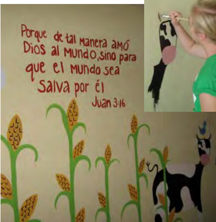
Mural del pasillo